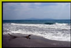
Spiaggia di Alberese

Qui all'Agriturismo Serratone, speriamo ancora una volta di avervi dato una opportunità ed una idea per trascorrere le vostre vacanze in Maremma!Vi aspettiamo, con o senza barca! A presto!